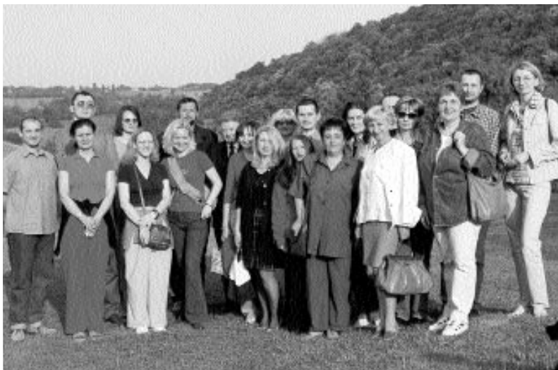
Семинар УДИ-EUROCLIO, мај 2002., Истраживачка станица Петница

Семинар Удружења за друштвену историју - Euroclio акредитован је и налази се у понуђеном Каталогу програма стручног усавршавања запослених у образовању за школску 2002/2003. годину. Министарство просвете и спорта Републике Србије, Београд 2002, стр. 250 и 251.